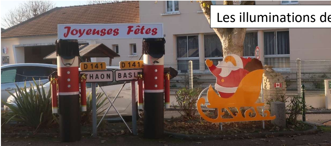
Les illuminations de Noël