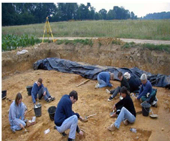
Fouille de Saint-Brice-sous-Ranes