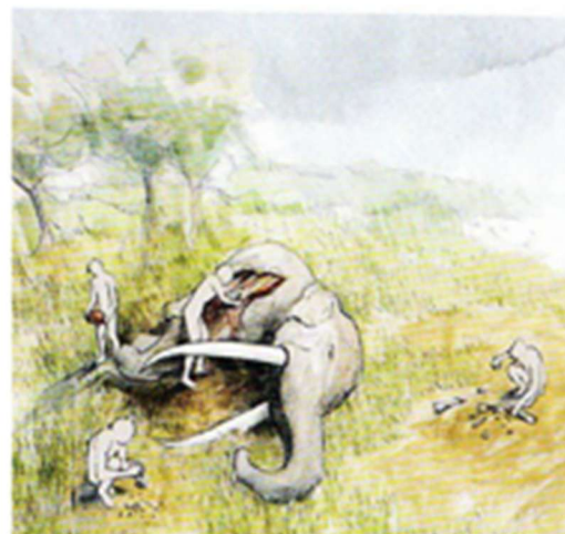
Scène de boucherie sur éléphant antique Ranville vers - 250000 ans ( dessin L.Juhel)