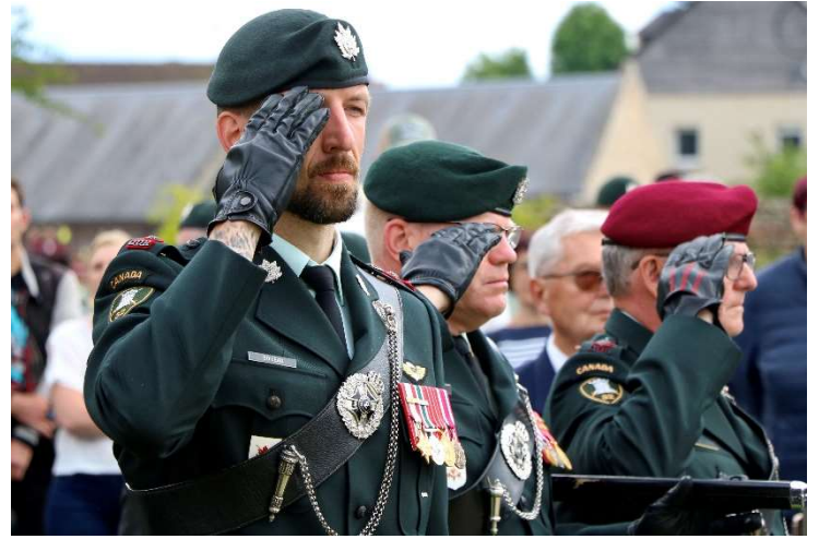
Cérémonie à l'Inukshuk, en mémoire du régiment des Queen's own the Rifles of Canada