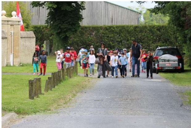
Arrivée des enfants de l'école depuis le cimetière