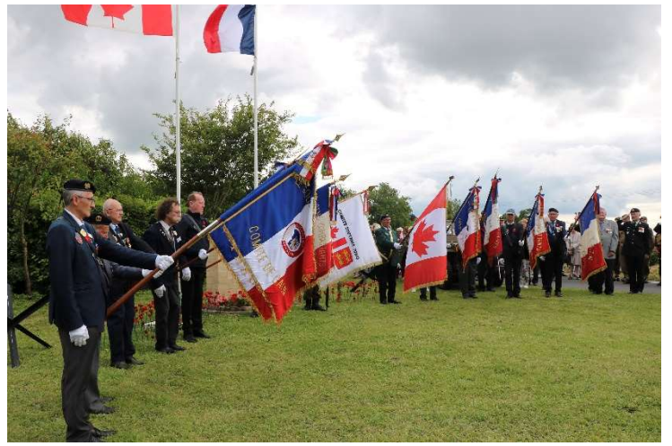
Cérémonie à la mare en mémoire des 5 soldats canadiens du rgt de la Chaudière enterrés le 7 juin 1944