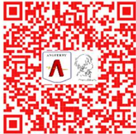
La libération d'Anguerny et de Colomby-sur-Thaon