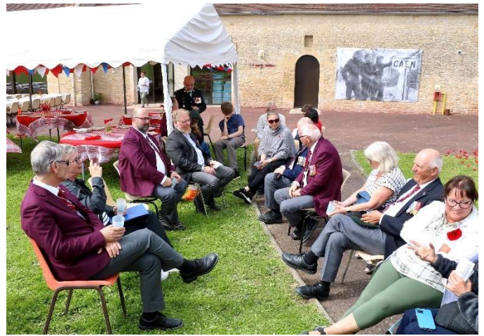
Arrivée des Amis canadiens de Lévis (Québec)