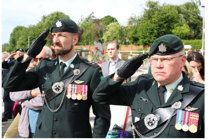
Inauguration du rond-point « Fort Garry Horse »