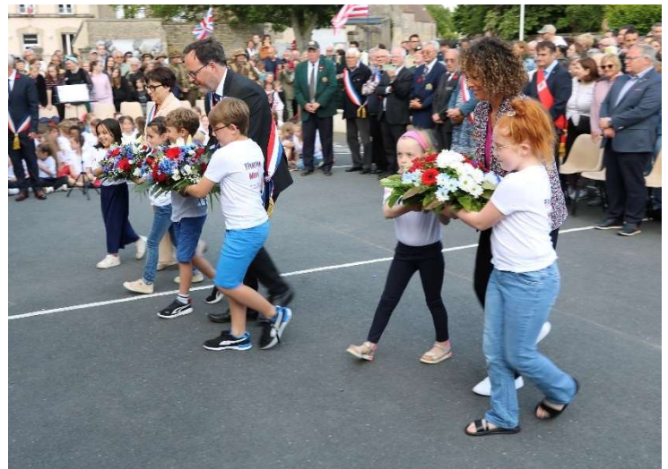
Cérémonie à l'école Louis-Valmont ROY