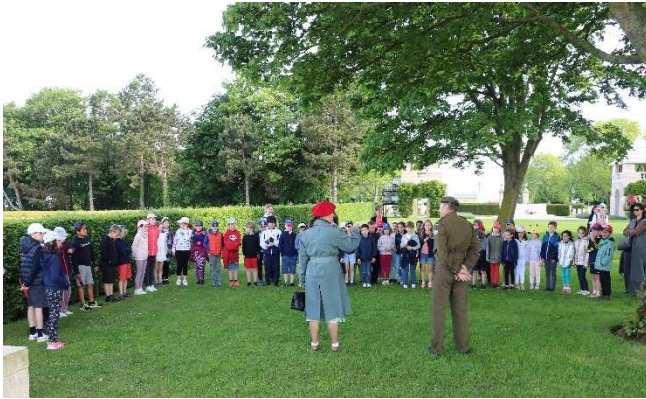
Visite du cimetière canadien de Bénvy-Reviers