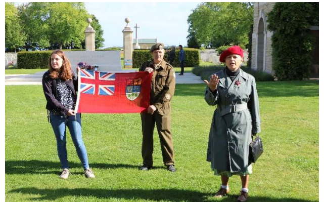
Conférence pour les enfants