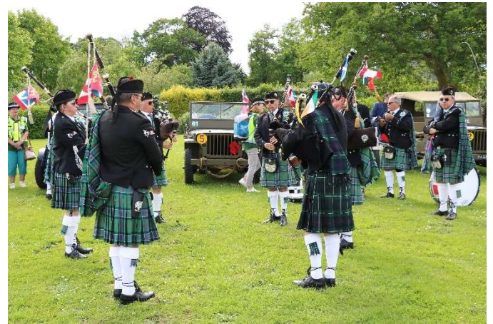
Arrivée de l'Association du Régiment de la Chaudière et des Pipes en drum