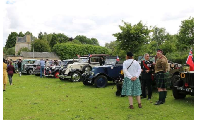
Arrivée des voitures anciennes