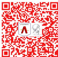
La vie avant la guerre à Anguerny et Colomby-sur-Thaon