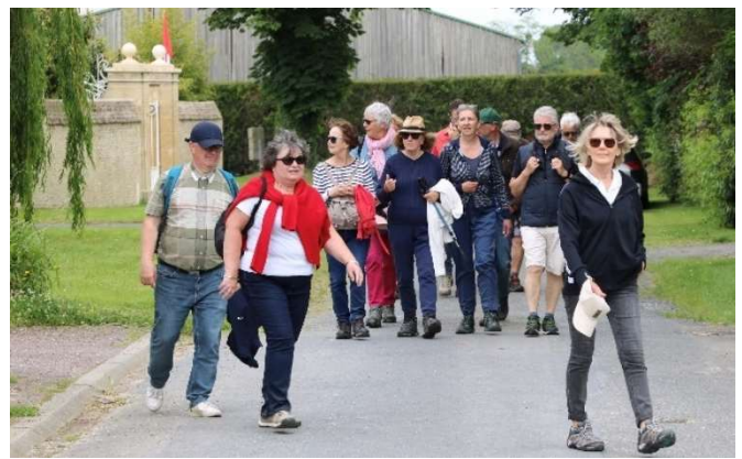
Arrivée des adultes de la randonnée