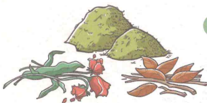
FLEURS, FEUILLES ET BRINDILLES