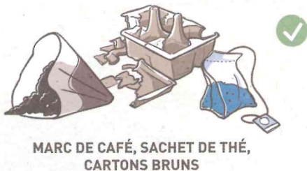
MARC DE CAFÉ, SACHET DE THÉ, CARTONS BRUNS

Conseil : fragmenter ces déchets pour faciliter leur décomposition.