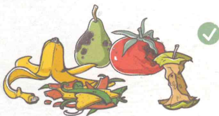
FRUITS ET LÉGUMES (ÉPLUCHURES, PELURES, TROGNONS)